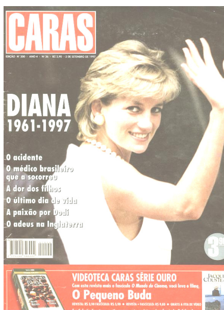
CARAS. nº 36, set. 1997.

DICIONÁRIO AURÉLIO. Rio de Janeiro: Nova Fronteira, 1999, p. 1347.