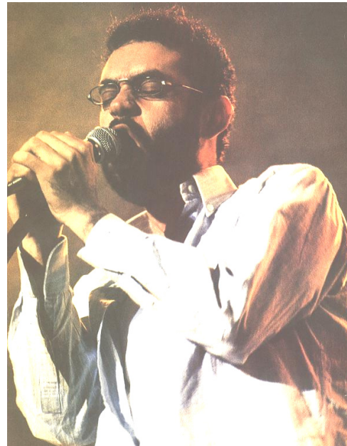
USINA DO SOM. SUPERPÔSTER, Editora Abril, Edição nº 1, mar. 2002.

mito. [Do gr. mýthos 'fábula', pelo lat. mythu .] S.m1. Narrativa dos tempos fabulosos ou heróicos. 2. Narrativa na qual aparecem seres e acontecimentos imaginários, que simbolizam forças da natureza, aspectos da vida humana, etc. 3. Representação de fatos ou personagens reais, exagerada pela imaginação popular, pela tradição, etc. 4. Pessoa ou fato assim representado ou concebido: Para muitos, Rui Barbosa é um mito. [Sin. (relativo a pessoa), nesta acepç.: monstro sagrado (q.v.).] 5. Idéia falsa, sem correspondente na realidade: As dívidas surgidas no inventário demonstram que a sua fortuna era um mito. (...)