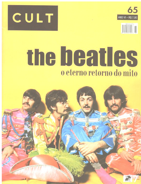
CULT. São Paulo: Editora 17, v. 65, jan. 2003.