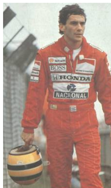
MANCHETE. Edição Histórica. Rio de Janeiro: Editora Bloch, maio 1994.