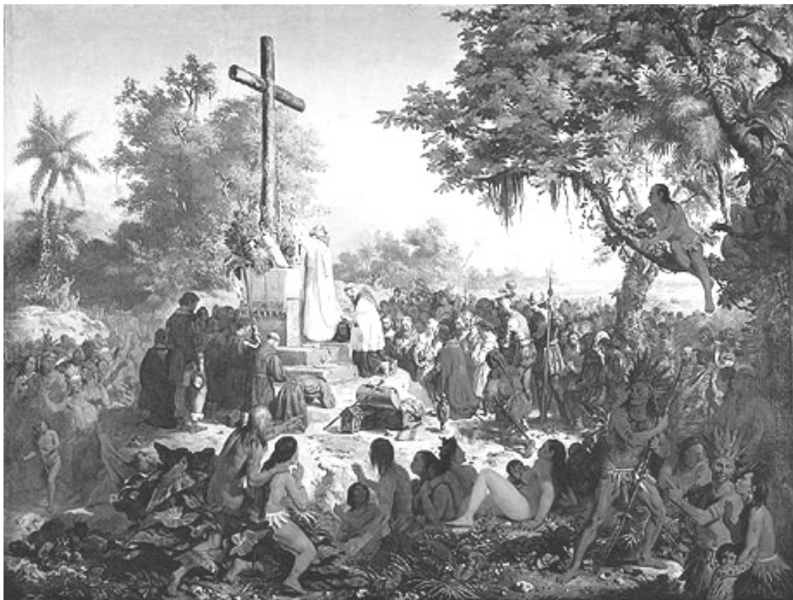
VICTOR MEIRELLES: Primeira Missa no Brasil, 1861 . Óleo sobre tela. Rio de Janeiro, Museu Nacional de Belas Artes.