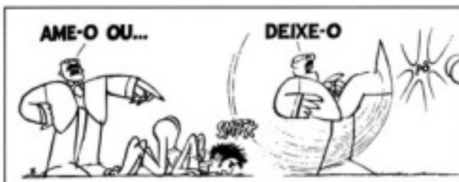
(Nosso Século. São Paulo: abril Cultural, 1980.)

A charge extraída do Almanaque do Ziraldo , de julho de 1979, e o fragmento retirado do livro O filho eterno são referências ao regime militar instalado no Brasil em 1964.